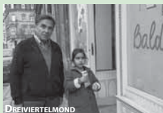
DREI VIERTEL MOND

Mi 18.01. 120. Geburtstag Ludwig Berger 20.00 Uhr WALZERKRIEG Regie: Ludwig Berger, DE 1933