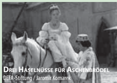
DREI HASELNÜSSE FÜR ASCHENBRÖDEL

Mi 4.01. Märchenfilme 20.00 Uhr DREI HASELNÜSSE FÜR ASCHENBRÖDEL Regie: Václav Vorlíček, DDR / CS 1972/1973